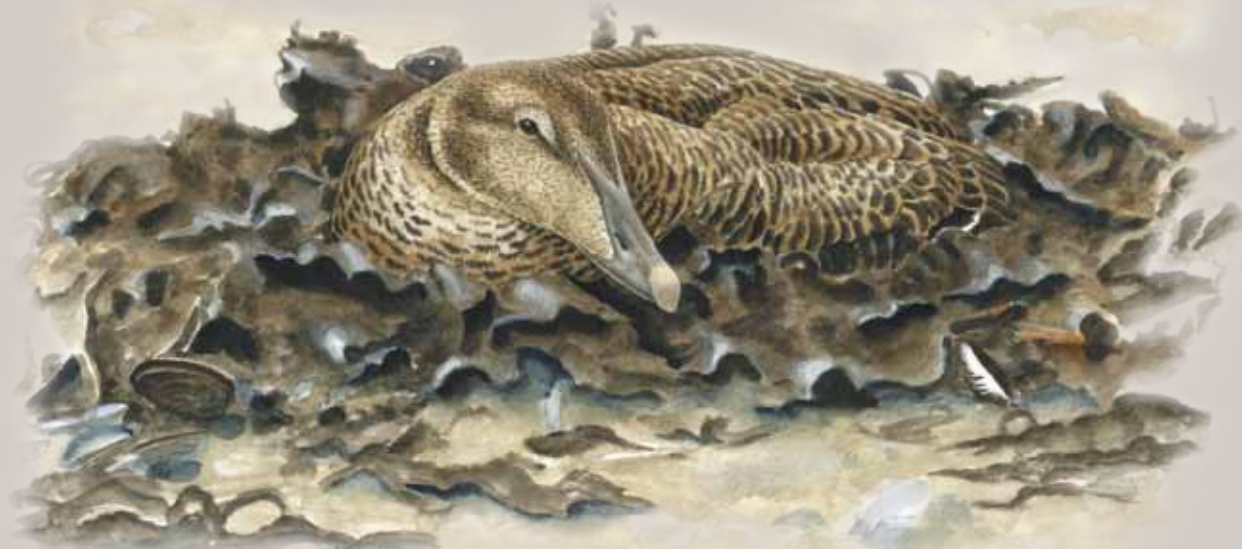
Ederfugl. Illustrator: Jens Overgaard Christensen

I perioden 15. marts til 15. juli er al færdsel forbudt på dele af Albuen, Enehøje, Rommerholm, Dueholm og Smedeholm. Jagt er forbudt eller reguleret i hele vildtreservatet.